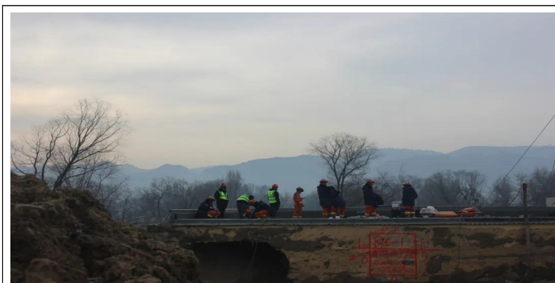
为加快被困和失联人员的搜救进度，三公局救援团队与消防官兵一起在抢险指挥点工作，持续观察救援作业现场。在海拔2150米的金田村，他们在冒着寒风，确保搜救计划执行到位。