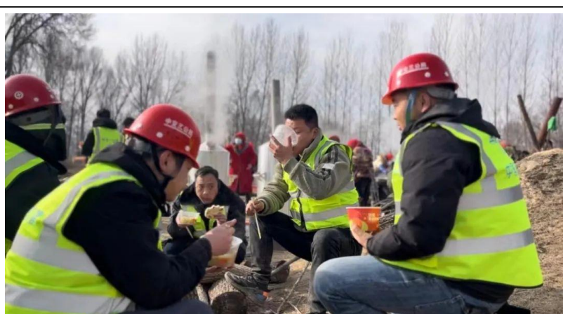
三公局救援团队的队员们连日来克服搜救条件艰苦、物资紧张的情况。他们围坐在救援现场附近的荒地里，吃着当天村民自发送来的饭菜，队员倍感珍惜、心怀感激。