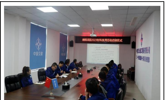
建筑行业结合生产情况精心策划，组织倡导各部室及各项目部积极参与“科技月”相关活动，确保全员参与并取得实效。