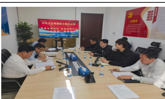
国际公司召开2023年“科技月”活动启动会。会议从促进属地化技术融合、面向国际化的语言和标准规范研究等方面进行了重点讲解。