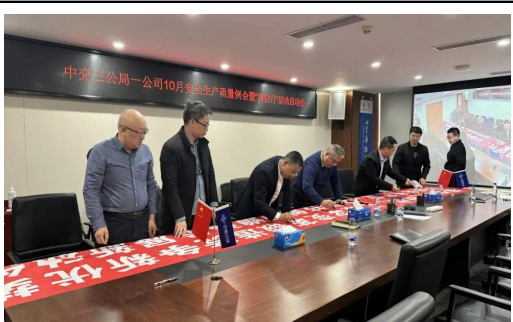
一公司召开了“科技月”启动仪式，集中学习了集团及局科技月活动方案，对公司科技月活动方案进行了宣贯，随后举行了签字仪式。

编者按：2023年是全面落实党的二十大精神开局之年，也是实施“十四五”发展规划承上启下的关键一年。为了深入贯彻落实局2023年工作会议部署和“高质量发展落实年”活动要求，三公局积极响应“拥抱智能时代，共创未来产业”的中交集团科技月活动主题，全面开展科技提升活动。局属各单位积极开展形式多样的“科技月”主题活动。