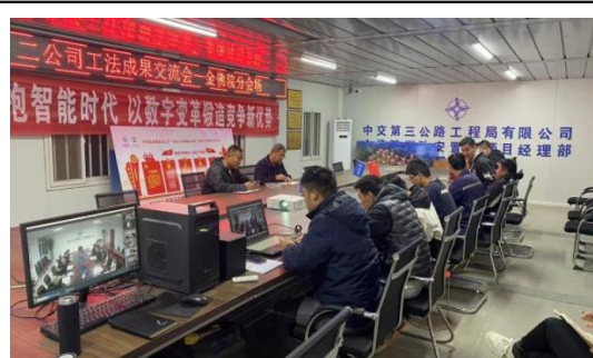
二公司组织召开工法成果交流会，为公司技术人员提供了一个良好的科研成果交流和学习平台。