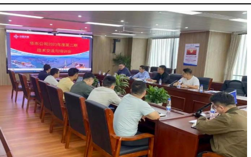
华东公司号召所属各项目部深度参与和开展“科技月”相关活动，开展专题学习、制度宣贯、技术交流会、相关系统培训等活动。