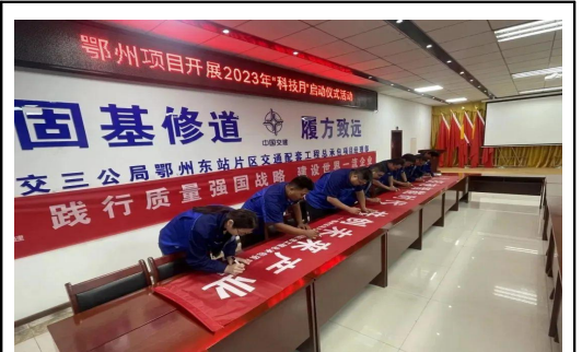
三公司鄂州项目组织员工进行主题签名仪式。