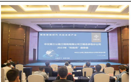
总承包公司召开“科技月”启动会，通过开展主题签名等一系列活动，普及科学知识，宣传科学思想，弘扬科学精神，营造良好氛围。