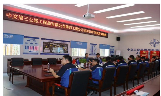
四公司“科技月”活动启动会上，宣贯了局《科技月活动方案》，开展了海棠华府项目电子沙盘演示讲座，发布了系列BIM工具。