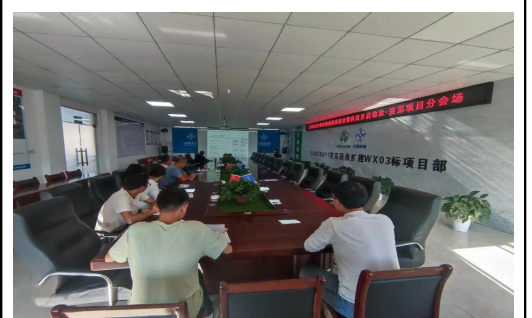
六公司召开2023年度科技进步考核关键引领指标推进会暨“科技月”启动会。