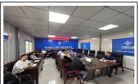
六公司郸城项目对“科技月”下达的指标进行再分解，并制定了下一步工作计划。