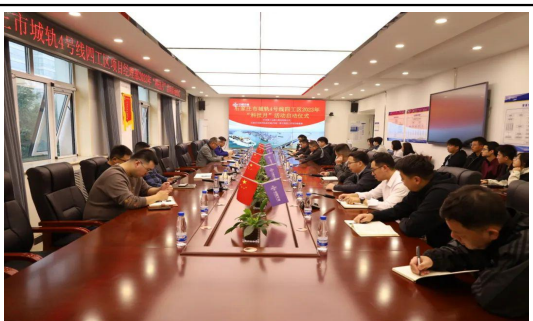
轨道交通公司石家庄地铁4号线四工区项目举行了“科技月”启动仪式，积极开展科技交流、BIM数字交流等培训会议。