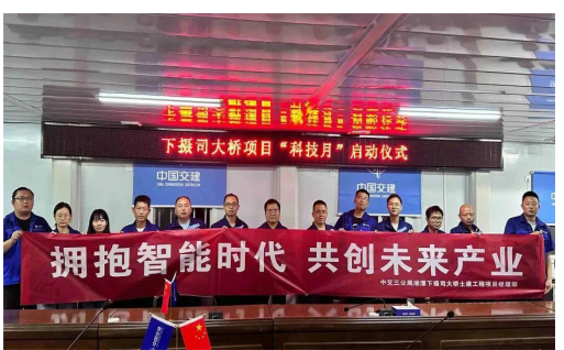
三公司下摄司大桥项目举行“科技月”启动仪式。